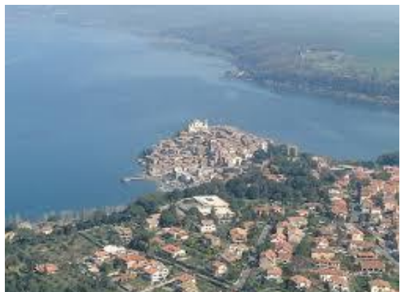
COMUNE DI ANGUILLARA SABAZIA (RM)